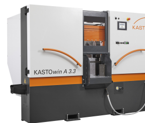
KASTOwin A 3.3

Max. Sägebreite 330 mm Jahrgang Juli 2019