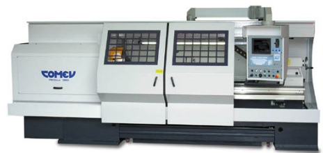
Comev PICO Due 260 x 1000

Spitzenhöhe 260 mm Spitzenweite 1'000 mm Umlaufdurchmesser 520 mm Spindeldurchlass 110 mm Drehzahl 2'000 U/min Jahrgang Mai 2007