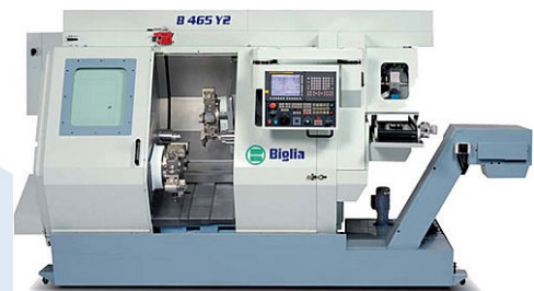
Mehrachsen Drehcenter Biglia B 465 Y2

angetriebene Werkzeuge 24 Stk Spindeldurchlass 80 mm mit LNS Stangenlader Doppelspindler mit 2 C-Achsen Doppelrevolver mit 2 Y-Achsen Jahrgang Februar 2012