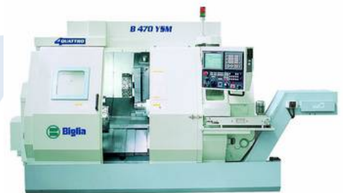
Mehrachsen Drehcenter Biglia B 470 YSM

angetriebene Werkzeuge 24 Stk Spindeldurchlass 65mm mit LNS Stangenlader Doppelspindler mit 2 C-Achsen Doppelrevolver mit 1 Y-Achse Jahrgang Mai 2010