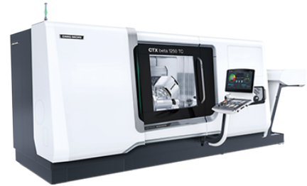
CTX beta 1250 TC 2nd

Drehdurchmesser bis 390 mm Längsweg (Z) 1'250 mm Drehzahl 4'000 / 5'000 U/min Spindeldrehzahl HSK63 12'000 U/min Werkzeugplätze 48 Stk Spindeldurchlass 102 / 67 mm Jahrgang Oktober 2019