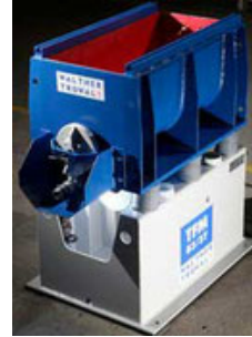
Walther Trowal TFM 83/37

Länge 830 mm Breite 370 mm Nutzvolumen 80 Liter Jahrgang April 2007