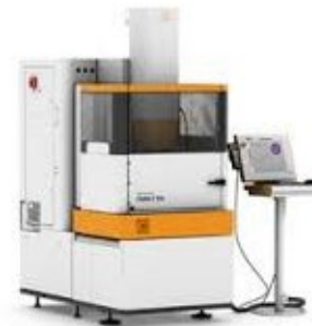
AgieCharmilles Form 20

X-Achse 350 mm Y-Achse 250 mm Z-Achse 250 mm Tischbelastung 200 kg Elektrodenplätze 4 Stk Fine Drill-Einrichtung Jahrgang Juni 2023