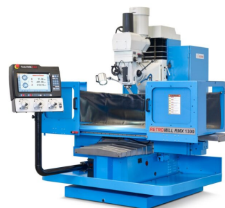
RETROMILL RMX 1300H

X-Achse 1'310 mm Y-Achse 480 mm Z-Achse 740 mm Tisch 1'500 x 400 mm Drehzahl SK40 5'000 U/min Jahrgang Februar 2022