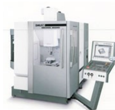
DMG DMU 50 digi

X-Achse 500 mm Y-Achse 450 mm Z-Achse 400 mm Tisch ø 630 x 500 mm Schwenkbereich B-Achse -5 / +110°, C-Achse 360° Drehzahl HSK63 14'000 U/min Werkzeugplätze 16 Stück Jahrgang März 2007