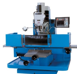
TRAK DPM - 1300

X-Achse 1'340 mm Y-Achse 510 mm Z-Achse 590 mm Tisch 1'500 x 400 mm Drehzahl SK40 4'500 U/min Jahrgang Mai 2005